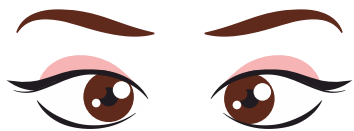
СВЕДЕНИЕ ГЛАЗ К НОСУ. ДЛЯ ЭТОГО К ПЕРЕНОСИЦЕ ПОДНЕСИТЕ ПАЛЕЦ И ПОСМОТРИТЕ НА НЕГО - ГЛАЗА ЛЕГКО «СОЕДИНЯТСЯ»

РАБОТА ГЛАЗ «НА РАССТОЯНИИ». ПОДОЙДИТЕ К ОКНУ, ВНИМАТЕЛЬНО ПОСМОТРИТЕ НА БЛИЗКУЮ ХОРОШО ВИДИМУЮ ДЕТАЛЬ: ВЕТКУ ДЕРЕВА, ЧТО РАСТЕТ ЗА ОКНОМ, РУЧКУ НА РАМЕ. ПОТОМ НАПРАВЬТЕ ВЗГЛЯД ВДАЛЬ, СТАРАЯСЬ УВИДЕТЬ МАКСИМАЛЬНО ОТДАЛЕННЫЙ ПРЕДМЕТ.